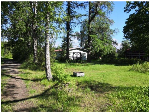
Maatilan talouskeskuksen pihapiiriä tilalla Rauhalahdi, päärakennus 60-luvulta

Tilalla Lahtela (213-423-2-16) on vanha asuinrakennus; viereisellä tilalla Rantalahtela (213-423-2-44) on pienehköjä talousrakennuksia. Tilalla Auringonnousu (213-423-2-40) on uudempi loma-asunto ja yksi talousrakennus.