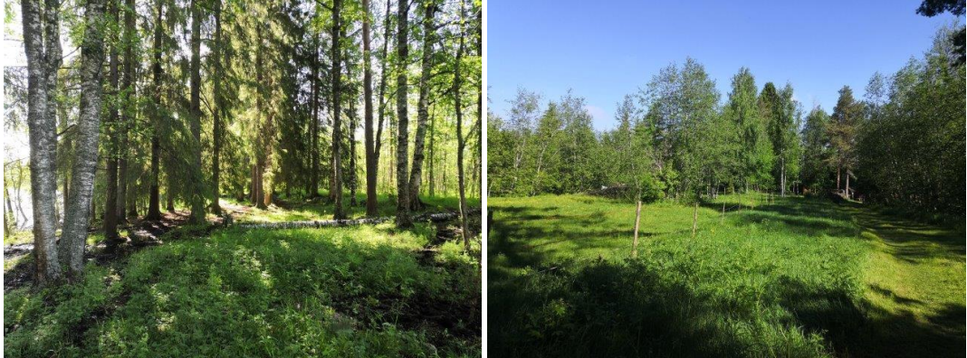
Maatilan talouskeskuksen ympärillä on hevosten laidunmaata rannassakin. Luontoselvityksen perus- teella tämän tyyppiset alueet ovat harvinaisia ja laidunalue tulisi säilyttää kaavassa.

saampaa. Tämän tyyppiset laidunalueet ovat hyvin harvinaisia ja alueen uhkana on laidun- nuksen loppuminen, rehevöityminen ja umpeenkasvu. Tulevaisuudessa olisi alueen säilyt- misen kannalta ensiarvoisen tärkeää, että nykyinen aktiivinen laidunkäyttö säilyisi.