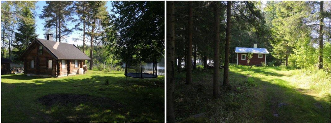
Uudempi loma-asunto tilalla Auringonnousu (vas.) ja pienehkö saunarakennus tilalla Sillanposki