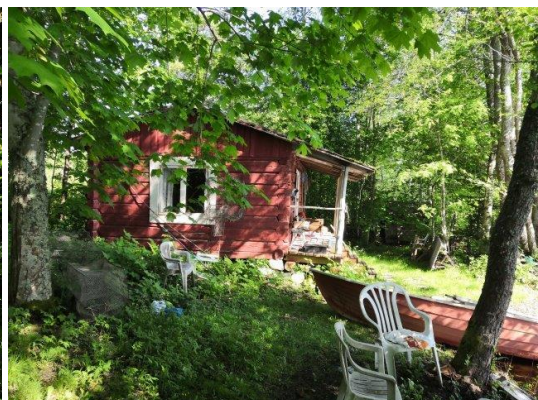
Vanha asuinrakennus tilalla Lahtela (vas.) sekä maatilan talouskeskukseen kuuluva erillinen ranta-sauna tilalla Rauhalahdi (oik.).