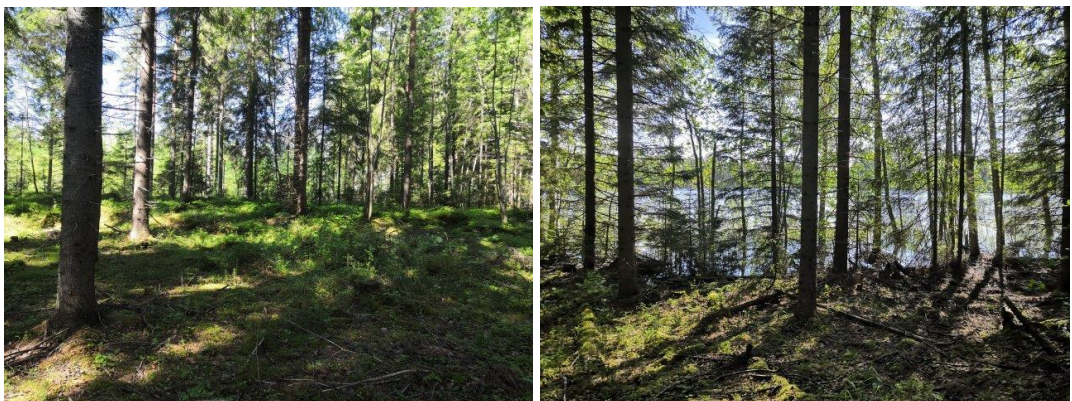
Sillan pohjoispuoleinen alue on kuusi-mäntyvaltaista sekametsää. Alueella ei ole erityisiä huomioon otettavia luontoarvoja.

Luontoselvityksen mukaan alueen puusto on sillalta pohjoiseen kuljettaessa pääosin kuusi-mäntyvaltaista sekapuustoa, joka on talousmetsäkäytössä. Lehtipuusto on nuorta, eikä liito-oravasta ole havaintoja. Kenttäkerroksessa esiintyy mustikkaa, puolukkaa ja rahkasammalta. Alueen linnusto on raportin mukaan tavanomaista. Luontoselvityksen perusteella pohjoiselle osa-alueelle ei ole tarpeen esittää erityismerkintöjä.