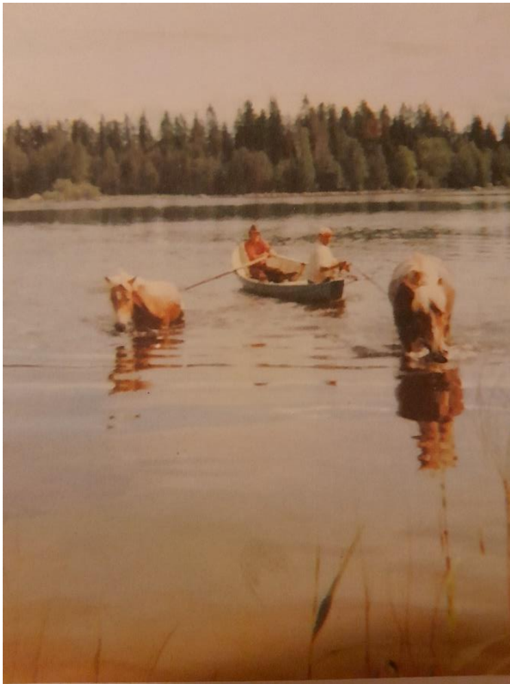
Hevosten uittoa tilan rannassa 1970-luvulla