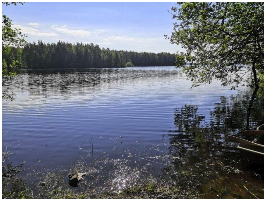
Maisemaa suunnittelualueelta Rauhajärven rannasta.